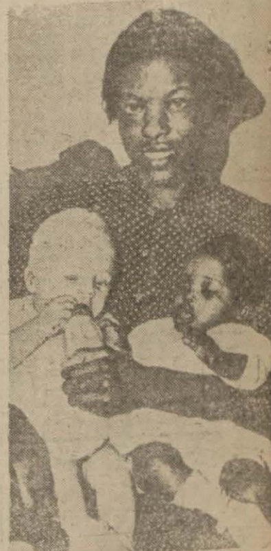
Amerikalı zenci kadın ikiz çocukları ile beraber (Yazısı 5 inci sayfada)