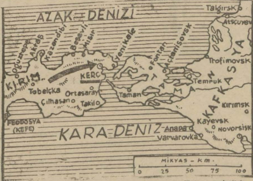
Almanlar tarafından zaptedilen Kerç limanı ile Kırımın vaziyetini gösterir harita

Londra, 18 (A.A.) — Uzaksarktan slman haberler hiç de emniyetbahş değildir. İngiliz mahafilli Japonya ile Birleşik Amerikanın anlaşabileceklerini zannetmemektedir. Çünkü Japonya Çin üzerinde hâkimiyet tesis etmek arzusunun sarfınazar etmemektedir. Vaşington siyasi mahafilli Çine karşı tecavüzî harbe devam ettikçe Japonya ile anlaşamayacağı fikrini beslemektedir.